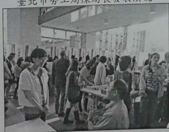
茶敘時間 促進交流