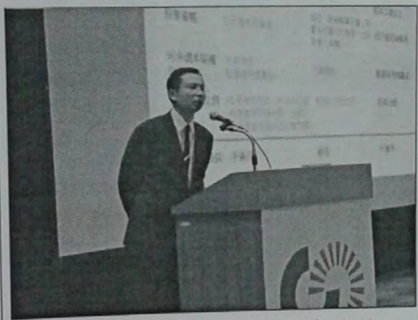
臺北市勞工局陳局長發表演說