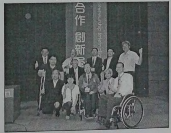
局長、貴賓、國內外演講人、承辦協辦單位合影